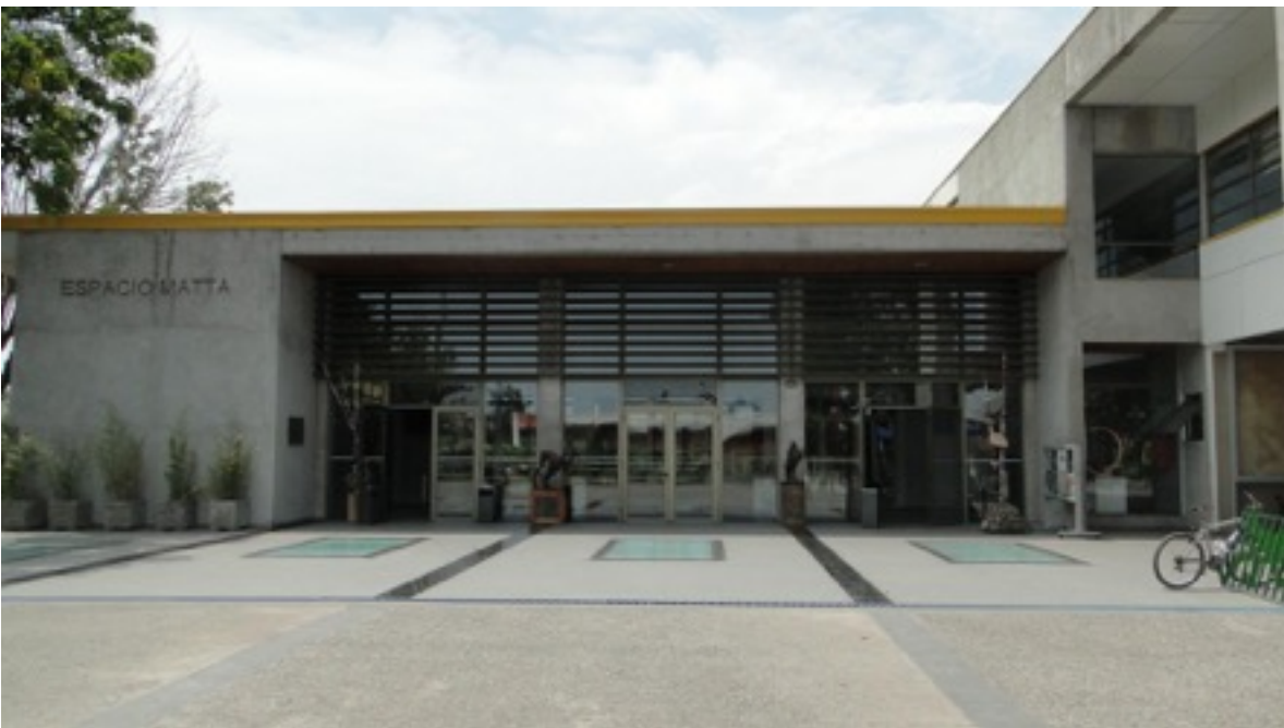
Fotografía de difusión